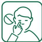
Éviter de toucher son visage