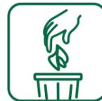
Jeter les mouchoirs souillés à la poubelle