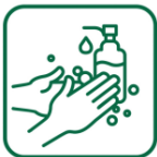
Se laver les mains souvent